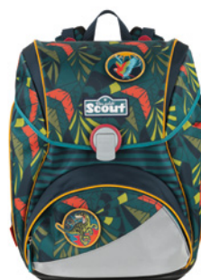
Scout Exklusiv Stickys Alpha „Jungle“