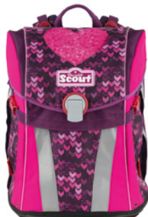
Scout Exklusiv Premium Sunny „Glitter Heart“