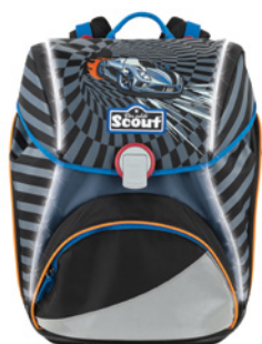
Scout Exklusiv Safety Light Alpha „Power Car“

Den Trend zum individualisierbaren Schulranzen bedient Scout auch mit seiner Serie „Stickys“. Zu jedem der insgesamt vier Motive werden sechs verschiedene Sticker geliefert, die mit hochwertigem Microklett an die Front des Alpha oder Sunny Schulranzens und die passende Sporttasche angebracht werden können.