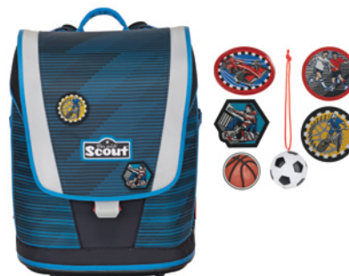
Scout Ultra „Sport“

Kinder, die in 2019 eingeschult werden, haben nun noch eine weitere Wahlmöglichkeit – mit dem neuen Hybrid-Modell Scout Ultra. Hybrid bedeutet: Schulranzen und Rucksack in einem. Denn der Scout Ultra hat eine stabile Front mit fester Deckelklappe, während die Seiten mit den innen liegenden Taschen soft und flexibel sind. Eine weitere Besonderheit sind die „Funny Snaps“, die jedem Ultra beiliegen: sechs verschiedene, farblich auf das Ranzendesign abgestimmte Sticker mit einem neuartigen, verblüffend einfachen Befestigungsmechanismus zum Anbringen an zwei farbigen Ösen auf der Deckelklappe und auf der passenden Sporttasche. Da macht das Individualisieren noch mehr Spaß!